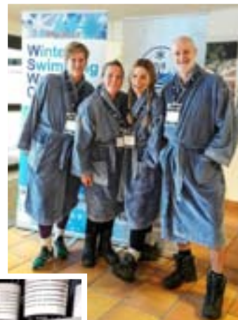
Delar av styrelsen