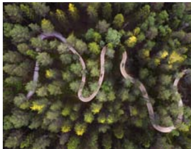
K A F Nytt's vinjettbild

På toppen av Vitberget, ett stenkast från centrala Skellefteå, ligger Skandinavien's största bike park. En modern cykelpark som innefattar en stor pump track, skills-loop, dirt track samt tre fina MTB-slingor av varierande svårighetsgrad med broar och träkonstruktioner snyggt integrerade i naturen.