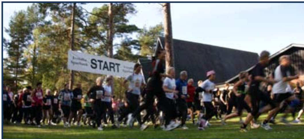
RM i terränglöpning i Kristianstad 2010

Men vad hände sedan? Jag vet inte, men kanske ett annat sätt att träna på, gå på gym, springa tjejmilen, andra mer större lopp, typ Lidingöloppet. Det är kanske roligare med dessa större evenemang? Man kan åka iväg hela familjen eller ett kompisgäng och dela på upplevelsen, istället för att en i familjen åker iväg