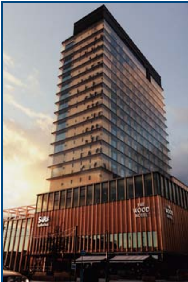
Sara kulturhus med The Wood Hotel

sektorn. Med efterkrigstidens stadsförnyelse följde att mycket av den äldre träbebyggelsen, bland annat stadshuset i trä, gick i graven och ersattes med modern bebyggelse.