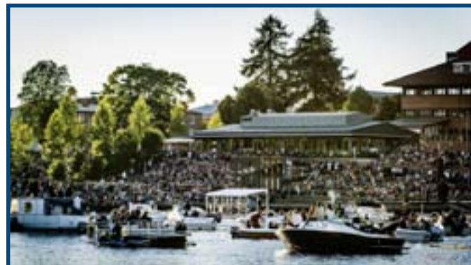
Gratis Live musikunderhållning från flotten på älven, drar alltid mycket folk

Skellefteå är idag en plats där livspusslet går ihop och vi litar på varandra i större utsträckning än på många