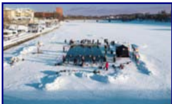
SM i vintersim