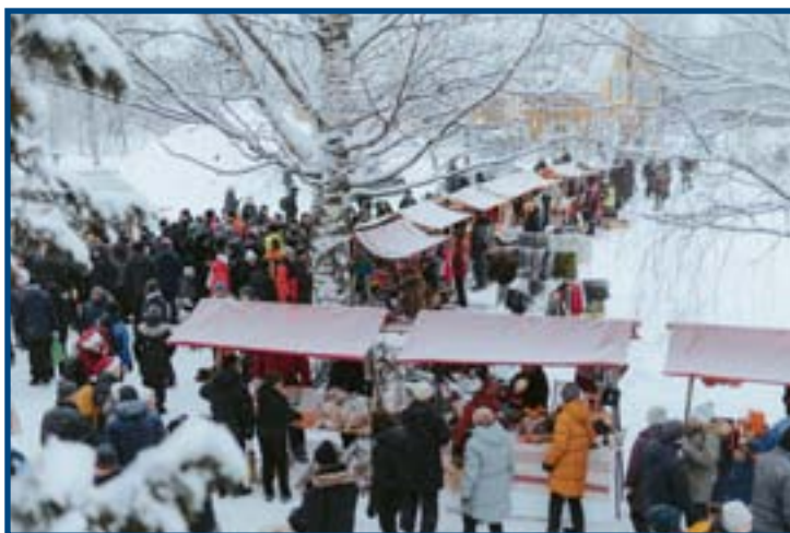
Hantverksarknad på Nordanåområdet